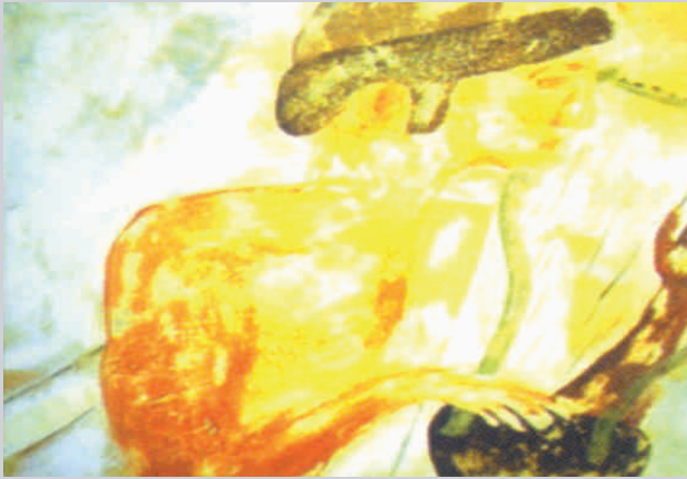
Mimicking Fresco Painting